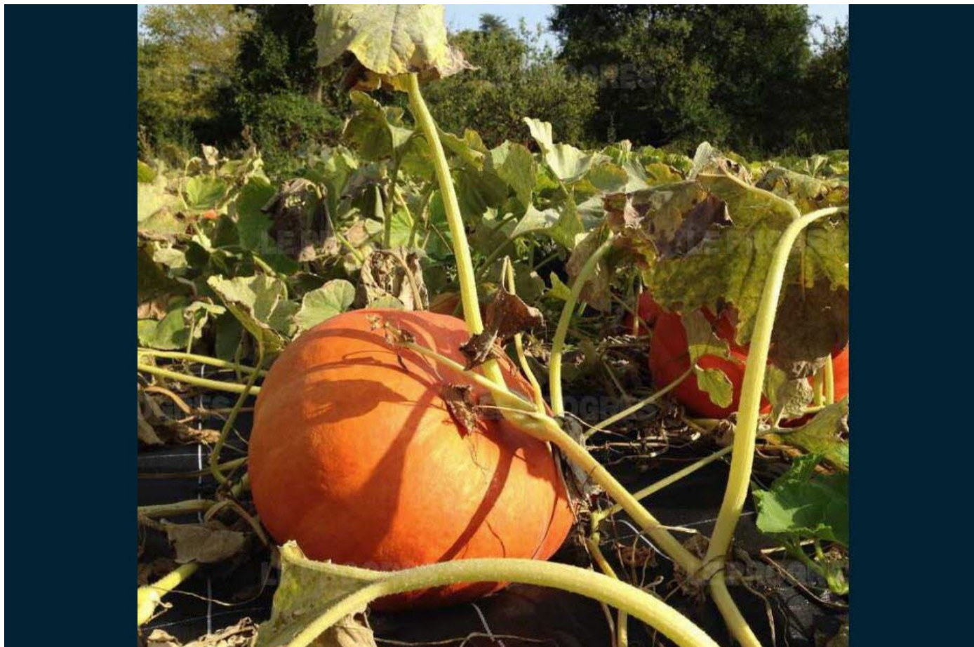
■ Le potimarron rouge en vente dès mercredi.